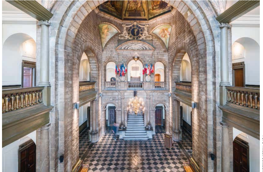
Het Plein wordt na de restauratie weer als de belangrijkste ruimte van het stadhuis ervaren